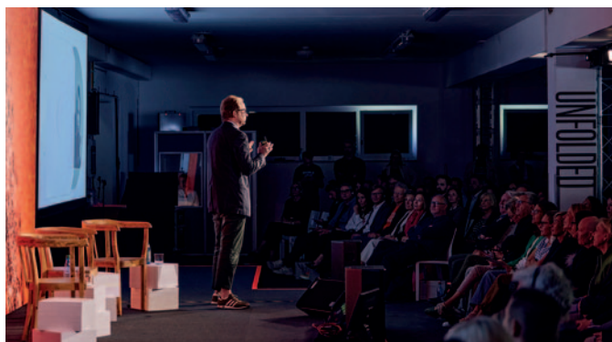
Vertreter von BMW, Hermès, Leica, Melitta, Serviceplan, aus Druckindustrie, Industrie und Forschung boten Einblicke in Markenerlebnisse, analoge Kommunikation, Kundenbindung und Nachhaltigkeit. In lebendigen Diskussionen beleuchteten sie Aspekte der Materialität und der emotionalen Markenkommunikation.

Papier der richtige Botschafter: »Denn den ersten Teller, den die Gäste bekommen, ist die Speisekarte.«