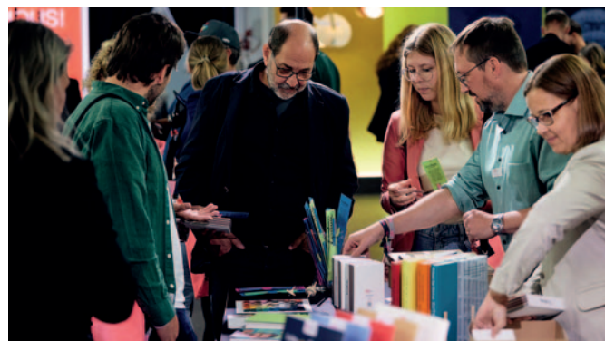
Unter dem Motto »Fibers & Brands« erlebten rund 800 Festivalgäste ein einzigartiges Event in einer fast schon idyllischen Umgebung aus analoger Technik und industrieller Atmosphäre der Papierfabrik Gmund.

Umgeben vom technischen Charme der Papierfabrik, zwischen bunten Papierrollen und Verarbeitungsmaschinen, präsentierten 35 Aussteller ihre Neuheiten aus Print, Design und Kommunikation. An den Ständen mit Grußkarten, Verpackungen, Blöcken, Kalendern, Büchern und Flyern sowie