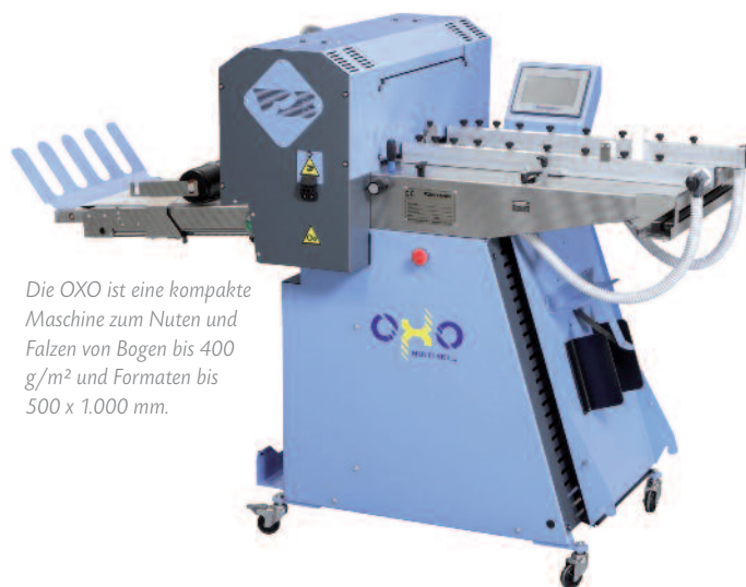
Die OXO ist eine kompakte Maschine zum Nuten und Falzen von Bogen bis 400 g/m 2 und Formaten bis 500 x 1.000 mm.

Mit der kombinierten Nut-/Falzmaschine OXO ist es nicht mehr erforderlich, für das kombinierte Rillen und Falzen ein Falzwerk hinter die Rillmaschine zu stellen.