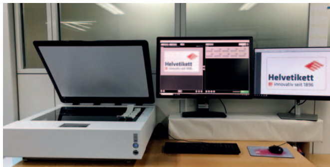
Bereits seit 2006 setzt die Helvetikett AG das scannerbasierte Inspektionssystem EyeC Profiler 600 DT im A2-Format in der Qualitätssicherung ein.