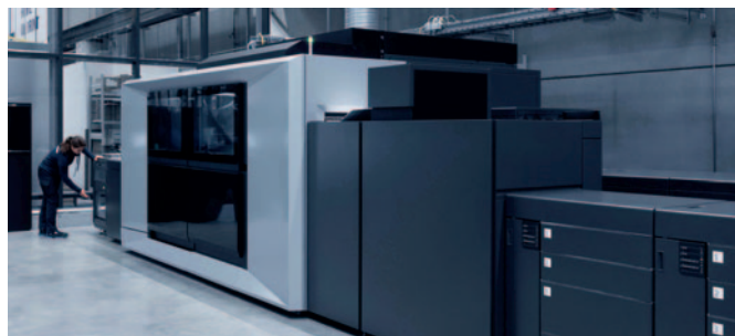
Mit dem Inkjet-Drucksystem Jetfire 50 schließt Heidelberg nicht nur eine Lücke in seinem Digitaldruckportfolio für den Akzidenzmarkt, sondern deckt damit auch Anwendungsbereiche ab, die vorher nur im Bogenoffsetdruck erreichbar waren.