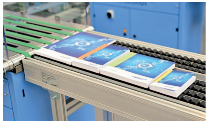
Print-on-Demand und Auflage 1 sind Produktionen, die mit dem Workflow Connex möglich sind.

Der Connex -Workflow bildet das Herzstück der Smart Factory , wobei es keine Out-of-the-Box-Lösungen gibt. Er stellt die Vernetzung zwischen der Unternehmensebene (MIS/ERP) und der Fertigungsebene sicher.